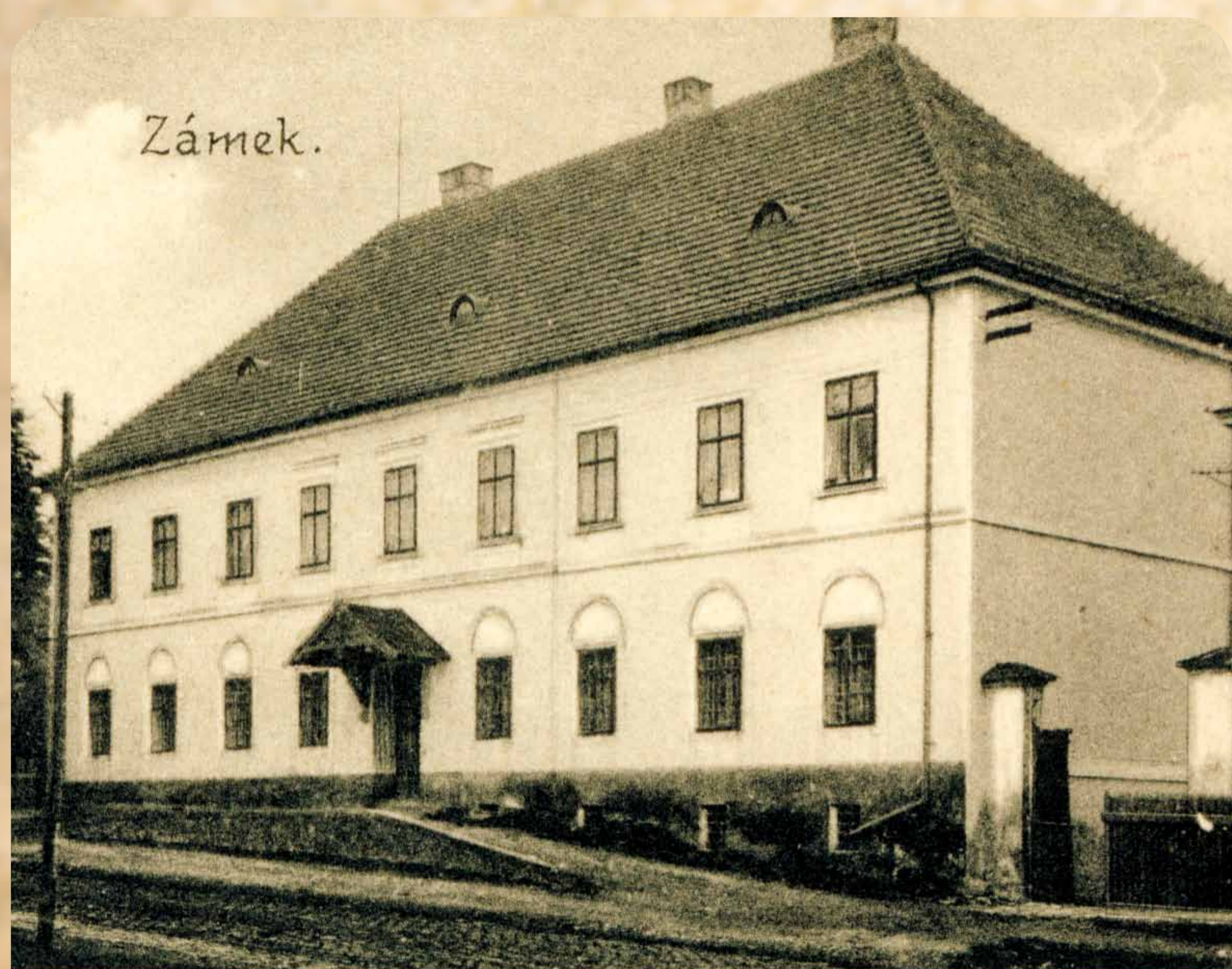
Roku 1762 získali Velké Pavlovice Habsburkové a za nich byla tvrz přestavěna na barokní zámek, který byl využíván pro správu dvora.

První zmínka o místě, kde stojí budova bývalého zámku, pochází pravděpodobně ze 14. stol., kdy zde byla vybudována tvrz, jako středisko žďárských cisterciáků. Tvrz je však písemně potvrzena až roku 1631. Podle jiných autorů byla pozdně renesanční tvrz vystavěna až v 17. století za Žampachů z Potštejna.