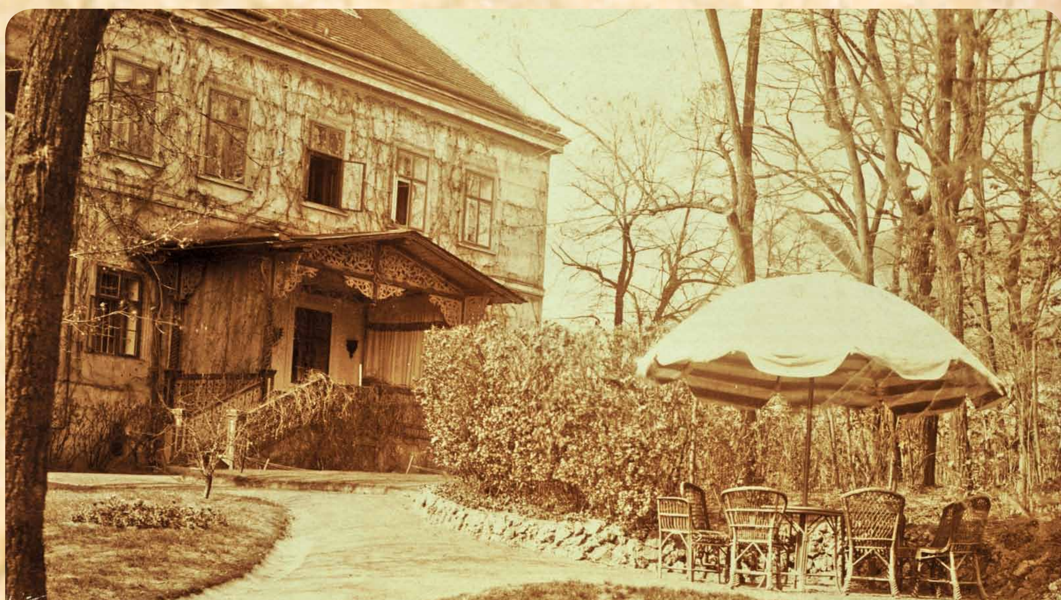
Za zámek byly rozsáhlé zahrady a park s několika rybníky a krásným altánkem. Park se svým vzhledem a charakterem podobal Lednickému parku, pouze nebyl tak rozsáhlý. Z původních rybníků se zachoval jen jeden, podél cesty na ulici Nádražní.