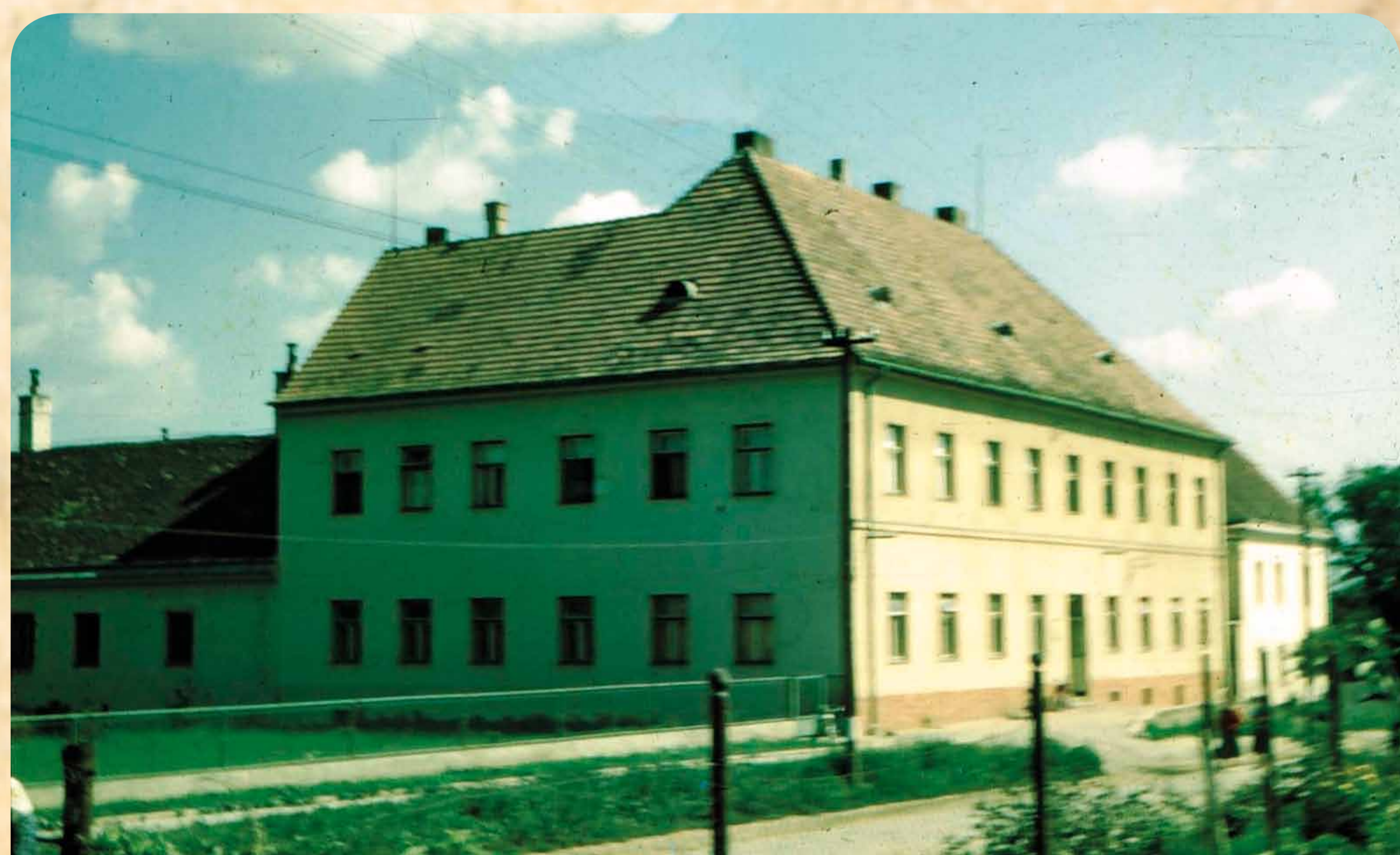
Budova zámku, která byla ve vlastnictví státu, se stala datem 4.11.1993 majetkem firmy Moravská Agra a.s. Velké Pavlovice, a to v rámci privatizace státních statků.

Zámek nejvíce proslavilo datum 16. července 1866. Tohoto dne sem přijelo okolo 400 mužů jízdy a pěchoty. Byl to generální štáb I. armády Pruské se všemi důstojníky, úřady, váleční kasou, přes 60 důstojníků, generálů a osobně korunní pruský princ Bedřich Karel z rodu Hohenzollernů – velitel této armády. Vojsko bylo rozloženo mezi okolní obce a statkářství. Nejvyšší důstojníci byli ubytováni na Velkopavlovickém zámku. Dostalo se jim, dle historických pramenů, toho nejlepšího zaopatření ve věci bydlení a stravy.