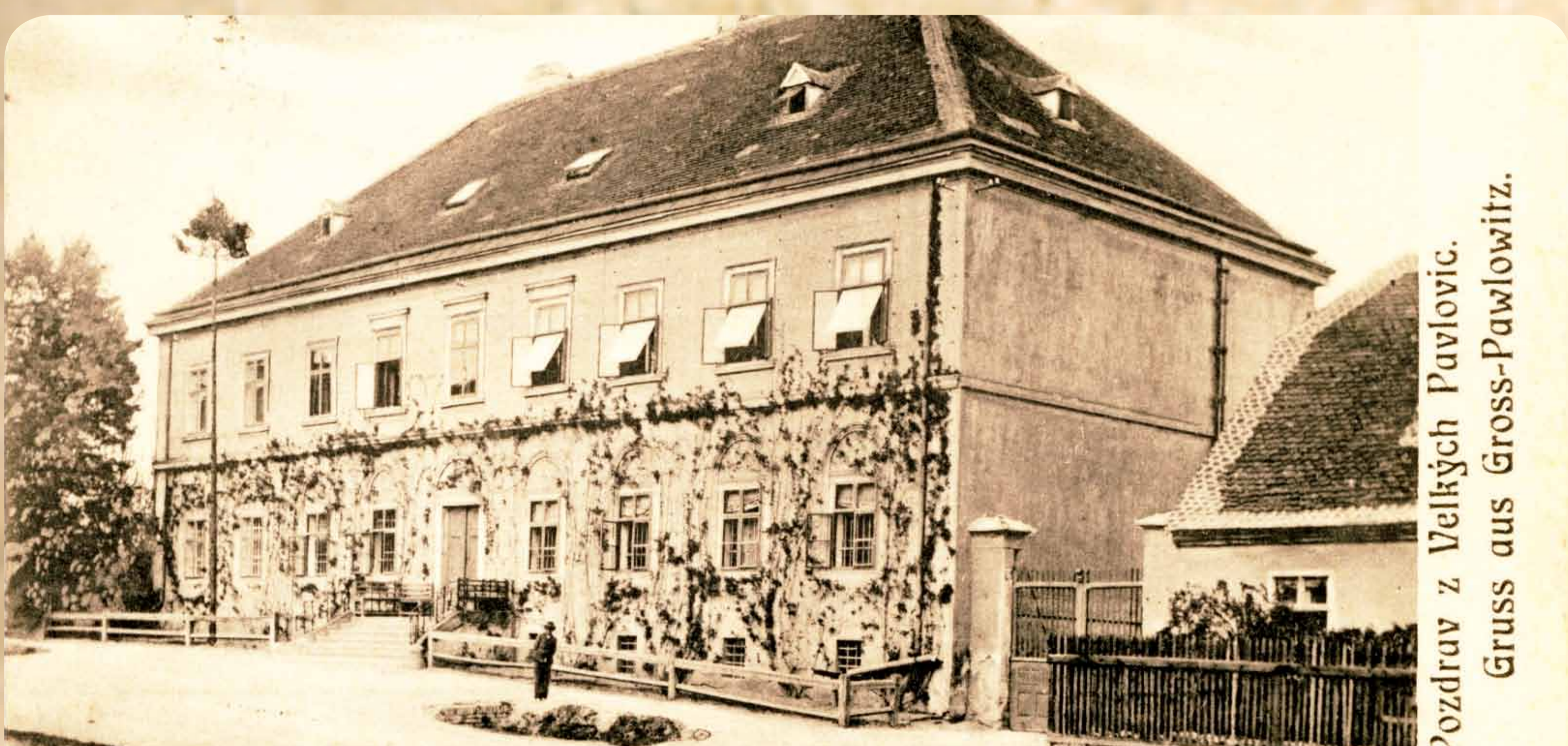
Pozdrav z Velkých Pavlovic. Gruss aus Gross-Pawlowitz.

Zámek nejvíce proslavilo datum 16. července 1866. Tohoto dne sem přijelo okolo 400 mužů jízdy a pěchoty. Byl to generální štáb I. armády Pruské se všemi důstojníky, úřady, váleční kasou, přes 60 důstojníků, generálů a osobně korunní pruský princ Bedřich Karel z rodu Hohenzollernů – velitel této armády. Vojsko bylo rozloženo mezi okolní obce a statkářství. Nejvyšší důstojníci byli ubytováni na Velkopavlovickém zámku. Dostalo se jim, dle historických pramenů, toho nejlepšího zaopatření ve věci bydlení a stravy.